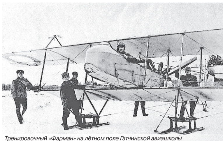
Тренировочный «Фарман» на лётном поле Гатчинской авиашколы