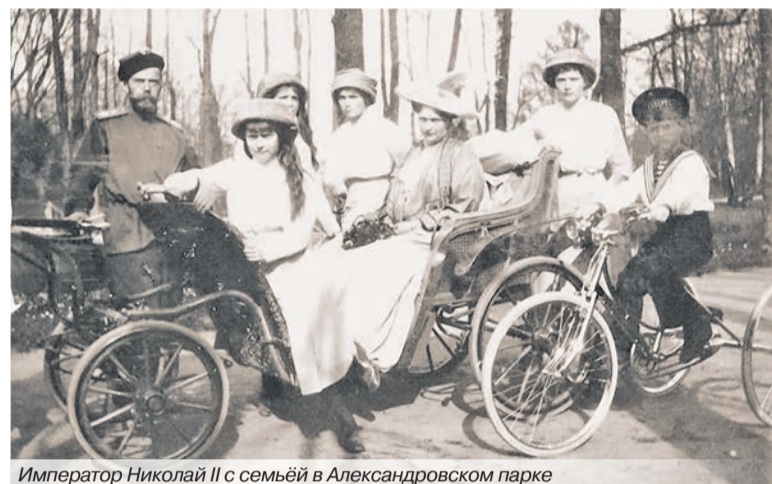
Император Николай II с семьёй в Александровском парке